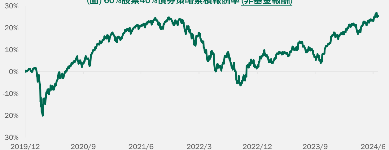
(圖) 60%股票40%債券策略累積報酬率 (非基金報酬)

60%股票40%債券參考指數為MSCI所有國家世界股票指數(ACWI)及Bloomberg全球公債指數， 非本基金績效指標 。圖文僅供參考，本公司無意藉此作任何徵求或推薦。過去績效不代表未來收益之保證。投資人申購本基金係持有基金受益憑證，而非本文提及之投資資產或標的。